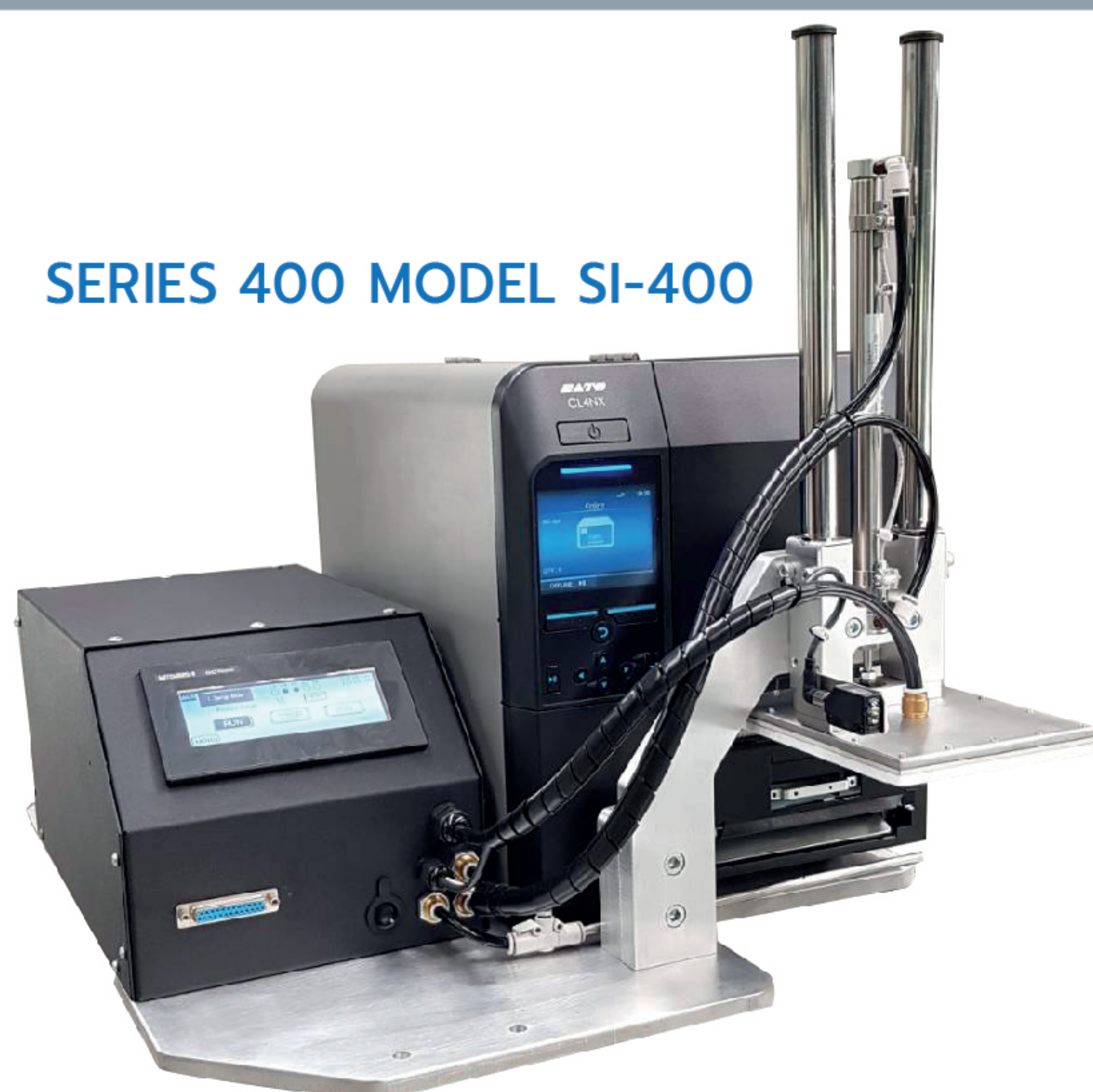
SERIES 400 MODEL SI-400

linerless labels do not have the common backing paper or liner. The labels are wound directly into rolls, and the adhesive layer of each label is in direct contact with the surface of the next label.